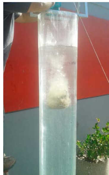
Con SikaMent® 100SC